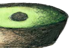
Abbildungen: Grundlagenfach BG 19gBC / 20gA